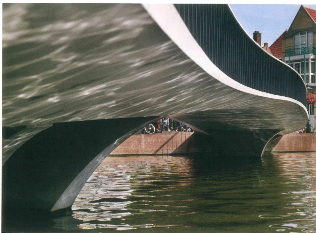
Een vloeiende witte lijn, zoals dit in het ontwerp bedoeld was.

Om passingsproblemen te voorkomen en indien nodig vóór de montage te kunnen oplossen zijn alle stekken na de productie van ieder element ingemeten. Vervolgens zijn alle elementen in een 3D-model in elkaar gepast om de aansluitingen te controleren.