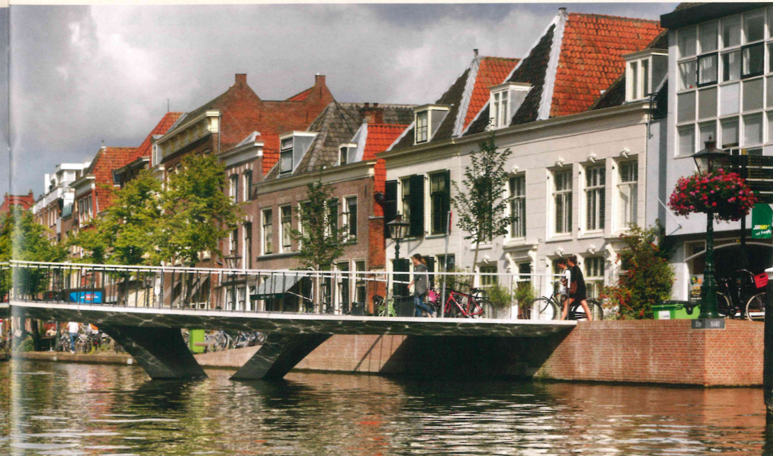
Een vernieuwende brug die ingetogen opgaat in de omgeving.

De delingen in het dek moesten zo onzichtbaar mogelijk zijn. Daarom is de lat voor het schoonbeton extreem hoog gelegd met toleranties van slechts 2-3mm. In de productie is continu gecontroleerd of de afmetingen voldeden aan de specificaties en de afwijkingen binnen de gestelde toleranties vielen. De wapening van de elementen, met een dekking van slechts 15 mm, is daarom volledig in de mal gevlochten, waarbij ook de gewichtbesparende EPS-blokken zijn meegenomen.