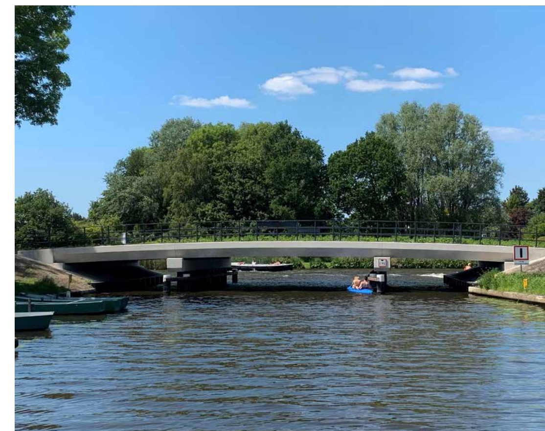
In Leiderdorp werd De Driegatenbrug vervangen in bouwteam met gemeente Leiderdorp en in samenwerking met Waco.

Binnen het duurzame beleid is er ook veel aandacht voor de mensen. In dit kader is Gebr. Schouls een erkend leerbedrijf. Jonge mede-