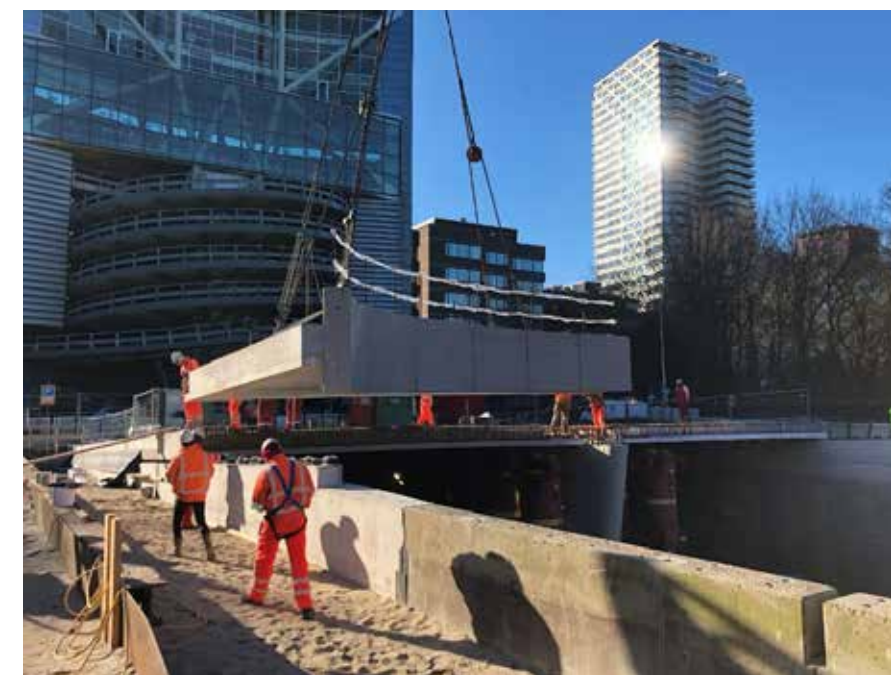
Bijna iedereen binnen Gebr. Schouls werkte mee aan de Overkluizing over de 12 Utrechtsebaan in Den Haag. Ook de samenwerking met Waco was meer dan welkom.

werken. De onderlinge betrokkenheid tussen werknemers is groot en resulteert in een soort familiegevoel. Een werknemer, afkomstig uit Angola, kwam hier bijvoorbeeld binnen als stagiair. Nu werkt hij als voorman en is hij totaal ingeburgerd in Nederland en bij Gebr. Schouls. Hij is ambassadeur van de bedrijfstak en in het kader van opleidingen bezoekt hij (basis)scholen om daar zijn verhaal te doen. Social return is voor ons een onderdeel van maatschappelijk verantwoord ondernemen." ■