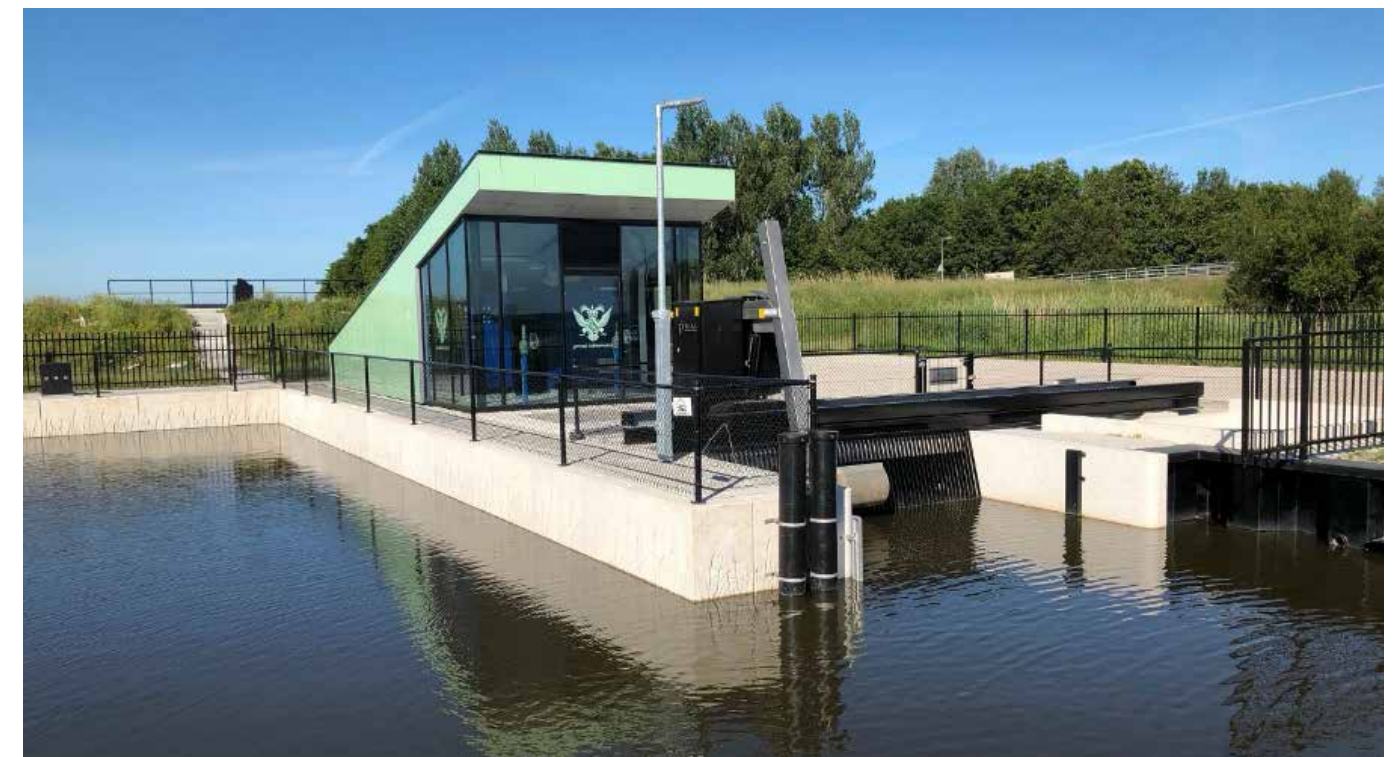
Ook op het gebied van gemalen heeft Gebr. Schouls veel expertise in huis

Van Belen: "We zijn nu op een punt aangekomen dat je dit duurzame beleid in alles terugziet. Het materieel is vervangen door duurzaam materieel; de energievoorziening op de bouwlocaties wordt niet meer geregeld met diesel-aggregaten, maar waar mogelijk met vaste stroomaansluitingen en Esavers waarbij het gebruik van diesel-aggregaten tot een minimum wordt beperkt; afval wordt gescheiden; we zijn ISO 14001-gecertificeerd en opereren