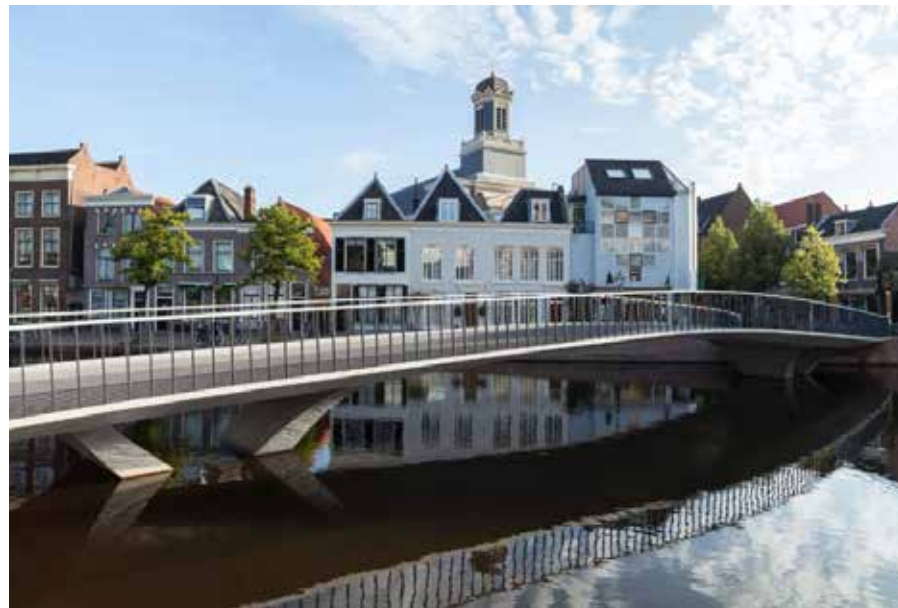
De Catharinabrug in Leiden kreeg de Nationale en Europese Betonprijs in verband met het slanke brugdek, uitgevoerd in ultra-hogesterktebeton (UHSB).

Als ergens de harde en de zachte kant mooi in evenwicht zijn, dan is het wel bij aannemingsbedrijf Gebr. Schouls. Aan de ene kant zijn daar die zware, betonnen kunstwerken - zoals de Catharinabrug in Leiden en de overkluizing over de A12 Utrechtsebaan in Den Haag - gemaakt door mensen die voorop willen lopen en ambitie hebben. Maar net zoveel aandacht is er voor veiligheid, goede verstandhoudingen en Social Return.