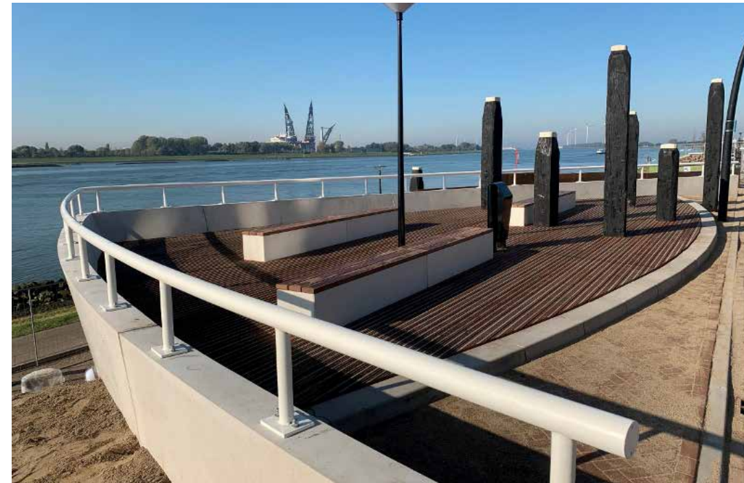
Ontmoetingsplaats Vuurbaak - Maassluis - gemaakt in samenwerking met Waco.

Werknemers die Gebr. Schouls eenmaal hebben gevonden, gaan hier niet zomaar meer weg. Dienstverbanden van dertig en veertig jaar zijn hier geen uitzondering, waardoor opgebouwde kennis binnen boord blijft. "Opdrachtgevers signaleren dat. We brengen onze ideeën met zelfvertrouwen en dat schept vertrouwen. Diezelfde wisselwerking speelt bij